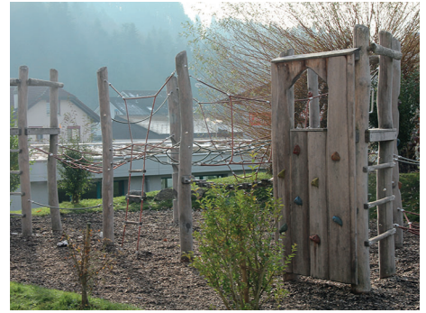
Spielplatz in Doppleschwand